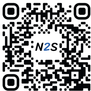
Novistar Fog 1200RC