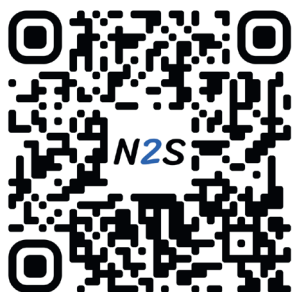
Cameo Flower HP